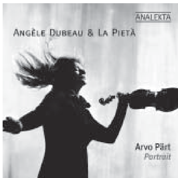
AN 2 8731 ARVO PÄRT: PORTRAIT