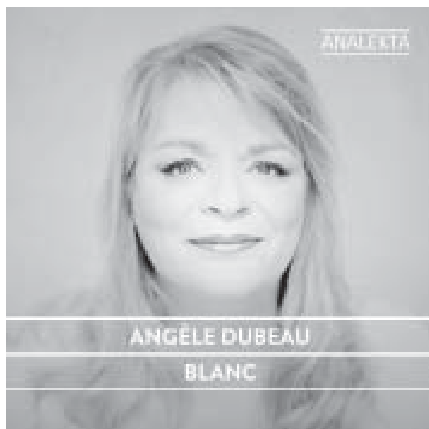
AN 2 8737 BLANC