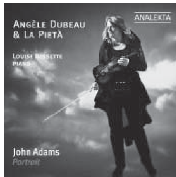
AN 2 8732 JOHN ADAMS: PORTRAIT