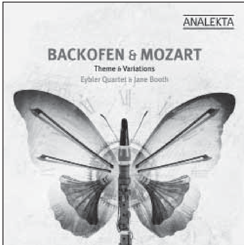
BACKOFEN & MOZART: Themes & Variations / Thèmes & Variations 2010 – AN 2 9949