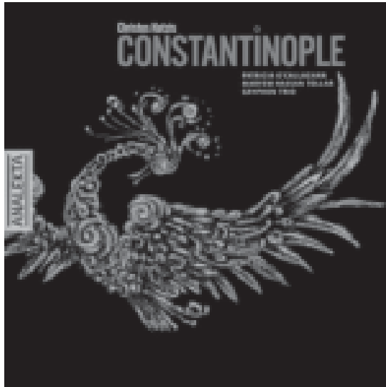
CHRISTOS HATZIS: Constantinople 2007 – AN 2 9925