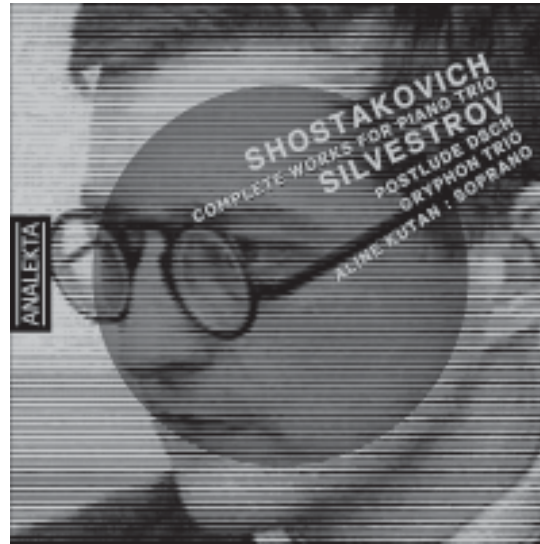
SHOSTAKOVICH: Complete Works for Piano Trio / Intégrale des trios avec piano SILVESTROV: Postlude DSCH 2006 – AN 2 9854