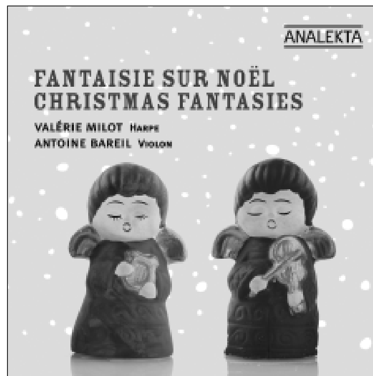
FANTASIE SUR NOËL CHRISTMAS FANTASIES 2010 – AN 6 1007