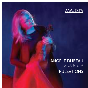
AN 2 8748 PULSATIONS