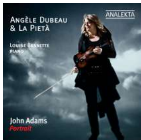
AN 2 8732 JOHN ADAMS: PORTRAIT