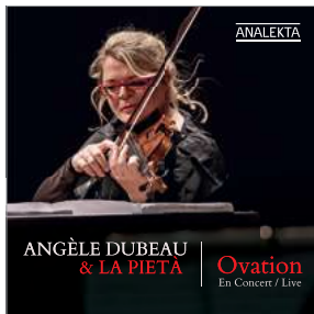
AN 2 8746 OVATION : EN CONCERT / LIVE