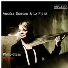
AN 2 8727 PHILIP GLASS: PORTRAIT