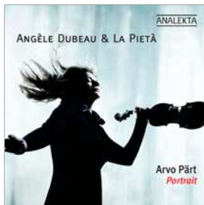
AN 2 8731 ARVO PÄRT: PORTRAIT