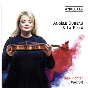
AN 2 8745 MAX RICHTER : PORTRAIT