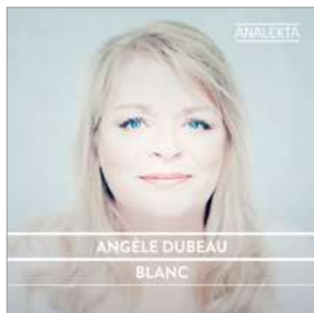
AN 2 8737 BLANC